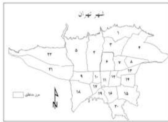
شکل ۲- محدوده و قلمرو پژوهش