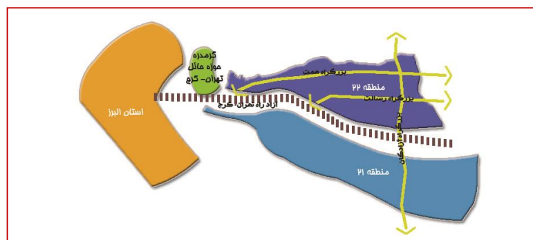
نقشه ۲- موقعیت استراتژیک منطقه ۲۲ شهر تهران از لحاظ جغرافیایی

- طرح مجموعه شهری، عمده فضاهای باز و سبزی موجود مجموعه شهری تهران را شامل چهار پارک جنگلی (چیتگر، قرچک، لویزان و سرخه حصار) و نیز کمربند سبز تهران، پارک چندمنظوره پردیسان و باغ گیاه‌شناسی ملی در محور تهران- کرج را برای نیازهای