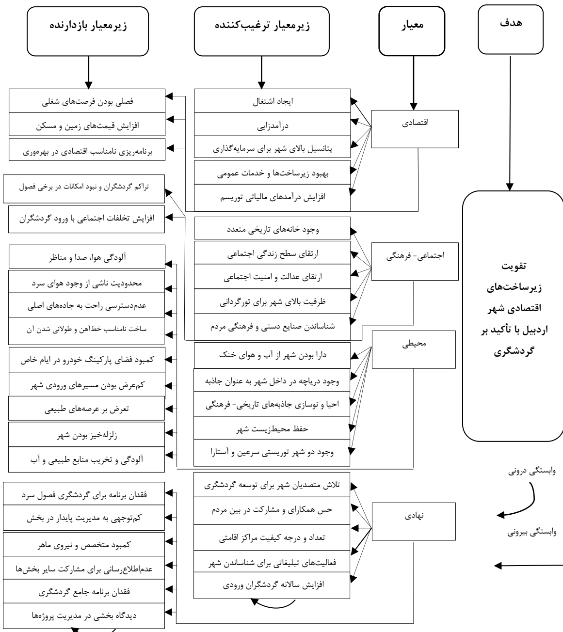
شکل ۱- شبکه‌ای و روابط درونی و بیرونی معیارها و زیرمعیارهای گردشگری شهر اردبیل

جدول ۱ و ۲ نشان می‌دهند که در شهر اردبیل، شناسایی شده است. در نهایت مدل ساختار شبکه‌ای ۲۰ نیروی ترغیب‌کننده و ۲۰ نیروی بازدارنده پژوهش بدین صورت ترسیم گردید.