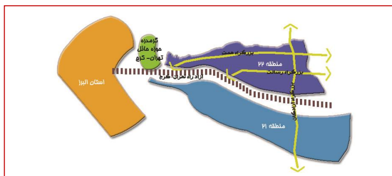
نقشه ۲- موقعیت استراتژیک منطقه ۲۲ شهر تهران از لحاظ جغرافیایی

- طرح مجموعه شهری، عمده فضاهای باز و سبز موجود مجموعه شهری تهران را شامل چهار پارک جنگلی (چیتگر، قرچک، لویزان و سرخه حصار) و نیز کمربند سبز تهران، پارک چندمنظوره پردیسان و باغ گیاه‌شناسی ملی در محور تهران- کرج را برای نیازهای