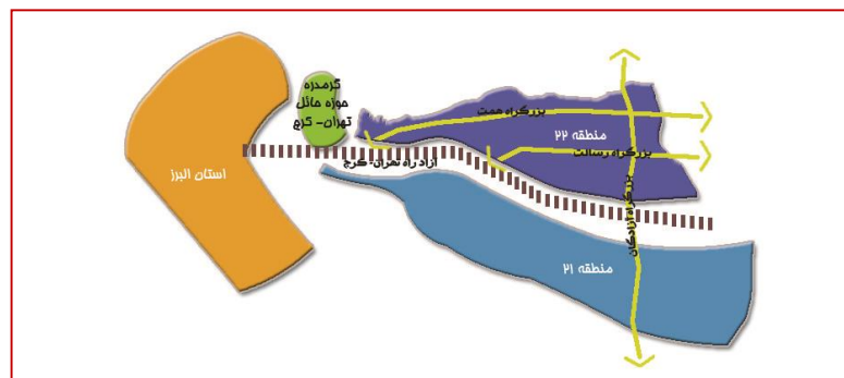
نقشه ۲- موقعیت استراتژیک منطقه ۲۲ شهر تهران از لحاظ جغرافیایی

- طرح مجموعه شهری، عمده فضاهای باز و سبز موجود مجموعه شهری تهران را شامل چهار پارک جنگلی (چیتگر، قرچک، لویزان و سرخه حصار) و نیز کمربند سبز تهران، پارک چندمنظوره پردیسان و باغ گیاه‌شناسی ملی در محور تهران- کرج را برای نیازهای