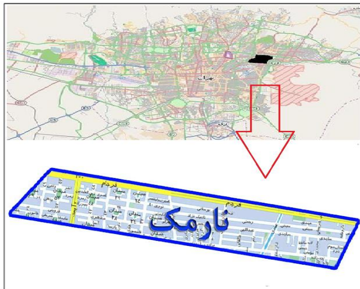
نقشه ۱- اطلاعات کل محدوده

می‌شناسند؛ در واقع، بزرگراه رسالت باعث تغییر و جدایی قابل توجهی در این محلۀ شد. قسمتی که در منطقه ۴ شهرداری قرار گرفته، در حال حاضر از شمال به خیابان فرجام، از جنوب به بزرگراه رسالت، از شرق به بزرگراه شهید باقری و از جهت غرب به خیابان هنگام ختم می‌شود. محلۀ نارمک از شمال با محلۀ علم و صنعت، از جنوب با منطقه ۸ شهرداری تهران، از طرف شرق با محلۀ کالاد، همسایه است. محلۀ نارمک به دلیل داشتن میدان‌های سرسبز و خیابان‌بندی‌های منظم، شناخته شده است. میدان اصلی نارمک با نام فعلی نبوت، مرکز اصلی و نشانه این محلۀ است. این میدان دارای هفت حوض متصل به هم است و از این‌رو در گذشته آن را میدان هفت حوض می‌خواندند. همچنین سایر اطلاعات پایه‌ای و نقشه مناطق تهران و محلۀ نارمک در نقشه ۱ و جدول ۲ نشان داده شده است. در جدول ۳، وضعیت فعلی محدوده براساس تکنیک SWOT، ارزیابی شده است.