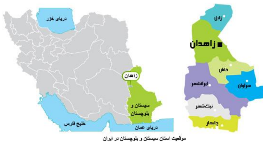
نقشه ۱- موقعیت شهر زاهدان در شهرستان زاهدان، استان سیستان و بلوچستان و ایران