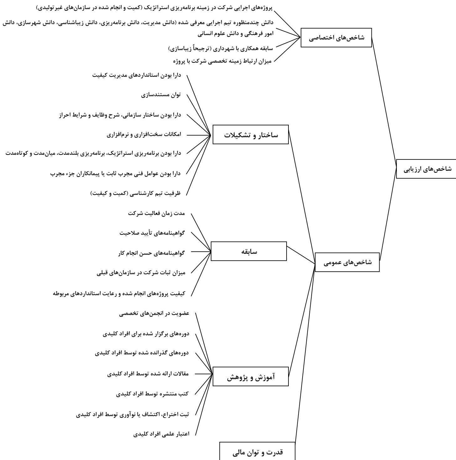
شکل ۲- درخت شاخص‌های ارزیابی