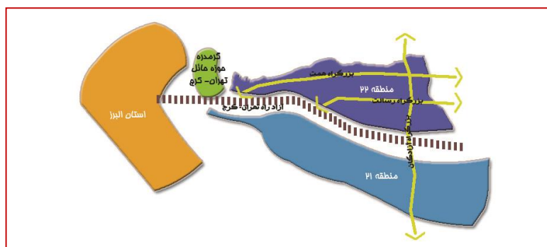
نقشه ۲- موقعیت استراتژیک منطقه ۲۲ شهر تهران از لحاظ جغرافیایی

- طرح مجموعه شهری، عمده فضاهای باز و سبز موجود مجموعه شهری تهران را شامل چهار پارک جنگلی (چیتگر، قرچک، لویزان و سرخه حصار) و نیز کمربند سبز تهران، پارک چندمنظوره پردیسان و باغ گیاه‌شناسی ملی در محور تهران- کرج را برای نیازهای