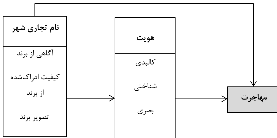
شکل ۲- مدل مفهومی تحقیق